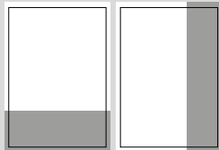
1/3 SEITE QUER ODER HOCH